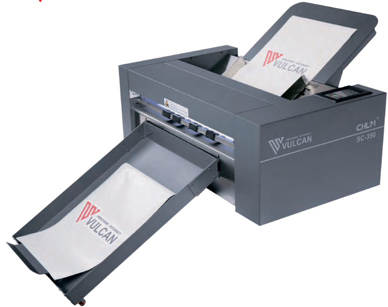
枚葉 自動給排紙装置付き カッティング プロッター