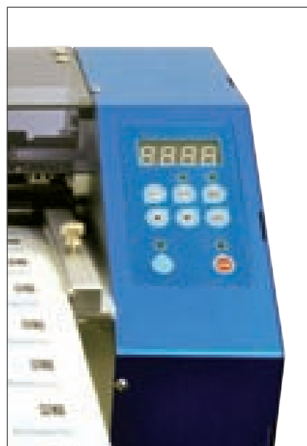
コントロールパネルを使用した簡単な数値の校正