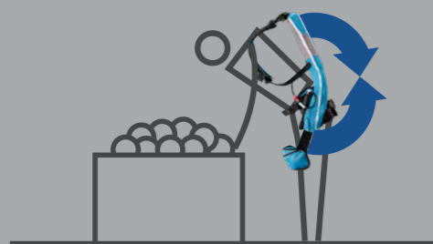
つらい姿勢を維持するときに