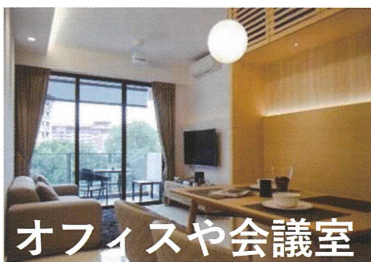
オフィスや会議室

その他 診療所、薬局、 待合室、宿泊施設、鉄道、 バス、遊覧船、観光施設、 金融機関、消防、工場、 介護施設、幼児施設など 多くの人が集まるあらゆる 場所の利用者とそこで働く 人の安全と安心のために 活躍しています